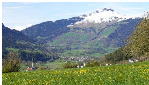
Sagogn mit Sicht auf Piz Mundaun