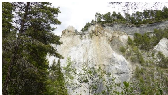
Rheinschlucht / Val Mulin

Rheinschlucht von verschiedenen Seiten Ausblick ins Val Mulin Panoramablick Sagogn/Mundaun